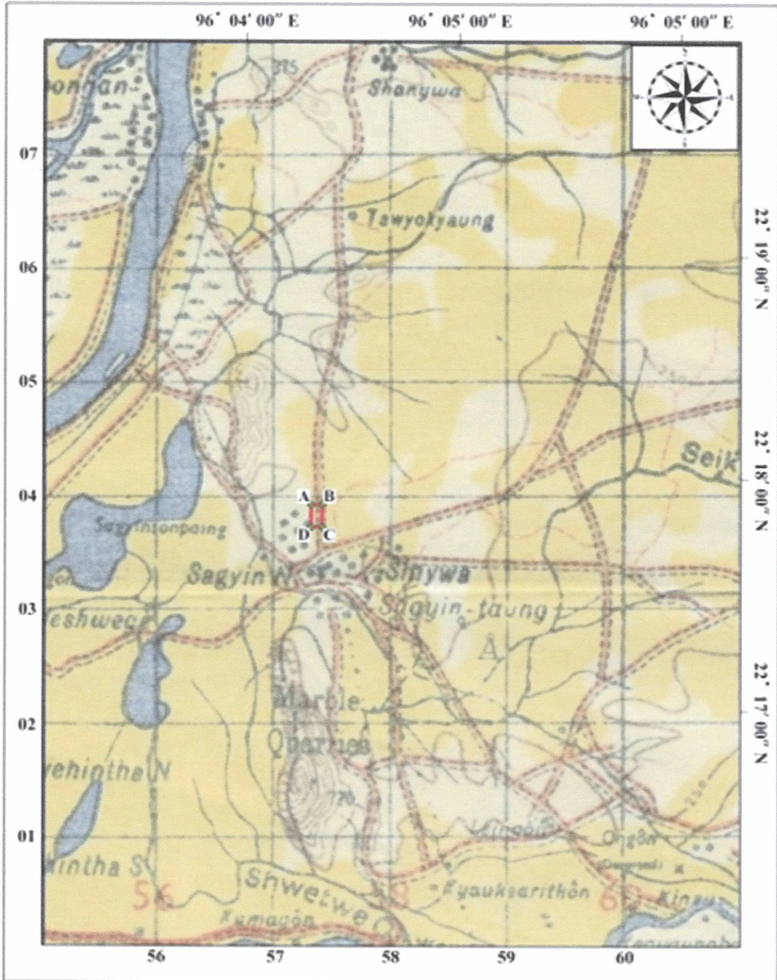
Part of Map Sheet No- 93 B/3

မန္တလေးတိုင်းဒေသကြီး၊ အောင်မြေသာဇံခရိုင်၊ မတ္တရာမြို့နယ်၊ မြေပုန်ကန်ကျေးရွာအုပ်စု၊ စကျင်ဒေသ၊ နှောတောင်နှင့် ကျောင်းတော်တောင်ဒေသရှိ မြန်မာစီးပွားရေးကော်ပိုရေးရှင်း၏ လုပ်ကွက်(၂) စီမံကိန်းတည်နေရာပြမြေပုံ