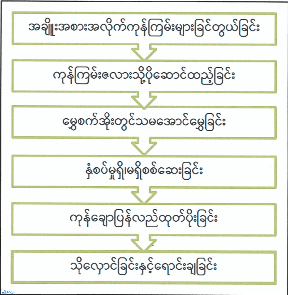
Process Flow Chart

Myanma Shwe Nagar Agricultural Group Co., Ltd မှ ရန်ကုန်တိုင်းဒေသကြီး၊ တွံတေးမြို့နယ်၊ ကုလားတန်ကျေးရွာ၊ အမှတ် (၁၂၄-က) တွင် အကောင်အထည်ဖော် ဆောင်ရွက်လျက်ရှိသည့် ဓာတ်မြေဩဇာများ ပြန်လည်ထုတ်ပိုးခြင်း၊ သိုလှောင်ခြင်းနှင့် ရောင်းချခြင်းလုပ်ငန်း၏