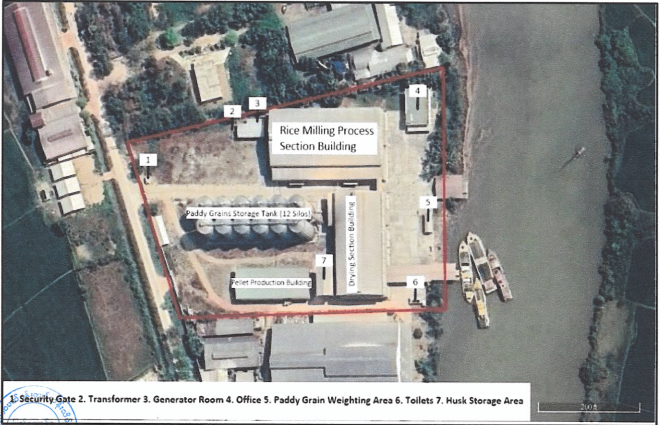
1. Security Gate 2. Transformer 3. Generator Room 4. Office 5. Paddy Grain Weighting Area 6. Toilets 7. Husk Storage Area

ဧရာဝတီတိုင်းဒေသကြီး၊ မြောင်းမြခရိုင်၊ မြောင်းမြမြို့နယ်၊ မြဟေသာစက်မှုဇုန်၊ ကွယ်လွယ်ကျေးရွာအုပ်စု၊ အမှတ် (၂၂၊ ၂၃၊ ၂၄) ရှိ မြေဧရိယာ (၄.၄၈) ဧကပေါ်တွင် Paddy Star Co., Ltd ၏ ဆန်စပါးအခြေခံတန်ဖိုးမြင့်ဆန်ထုတ်လုပ်သည့်လုပ်ငန်းအတွက်၏ အဆောက်အဦ တည်နေရာပြပုံ