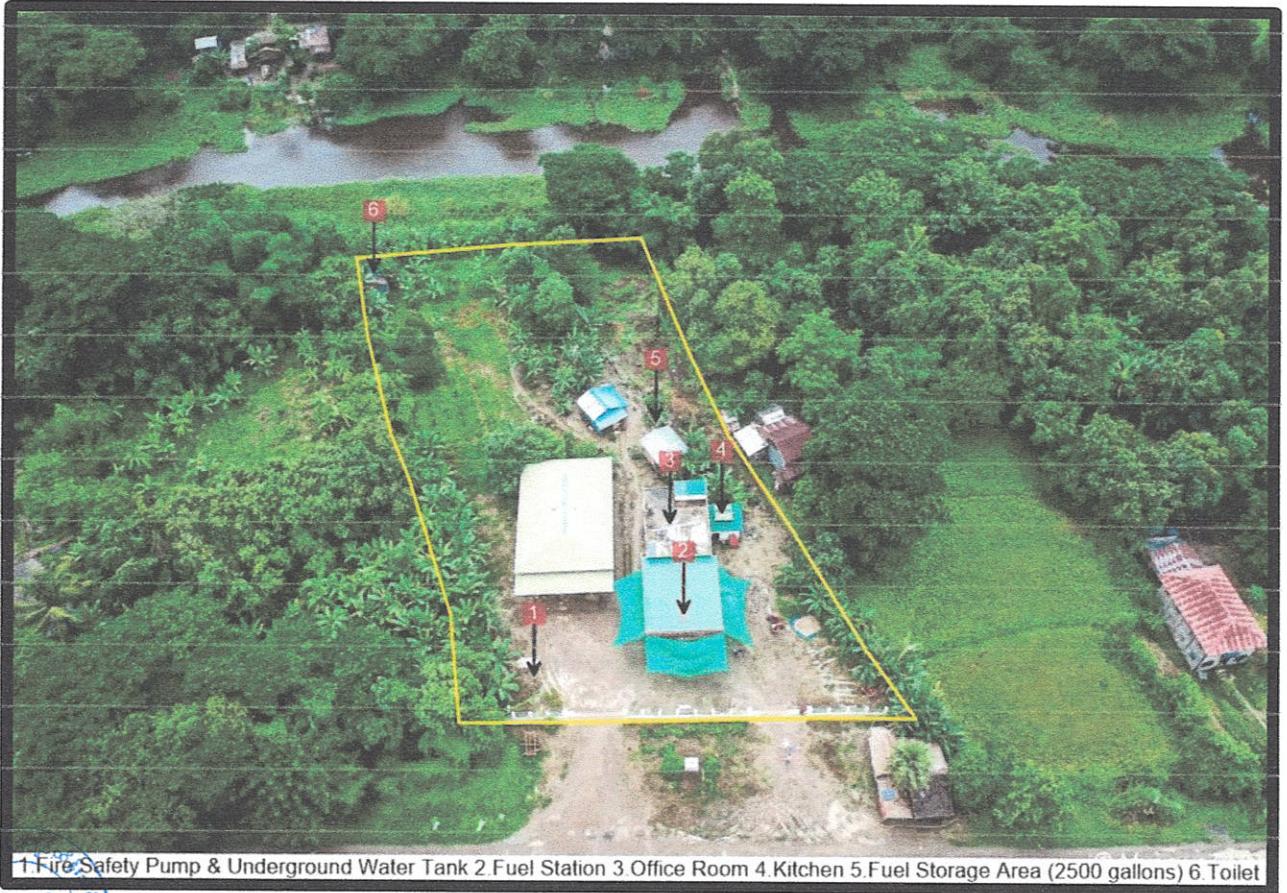
1. Fire Safety Pump & Underground Water Tank 2. Fuel Station 3. Office Room 4. Kitchen 5. Fuel Storage Area (2500 gallons) 6. Toilet