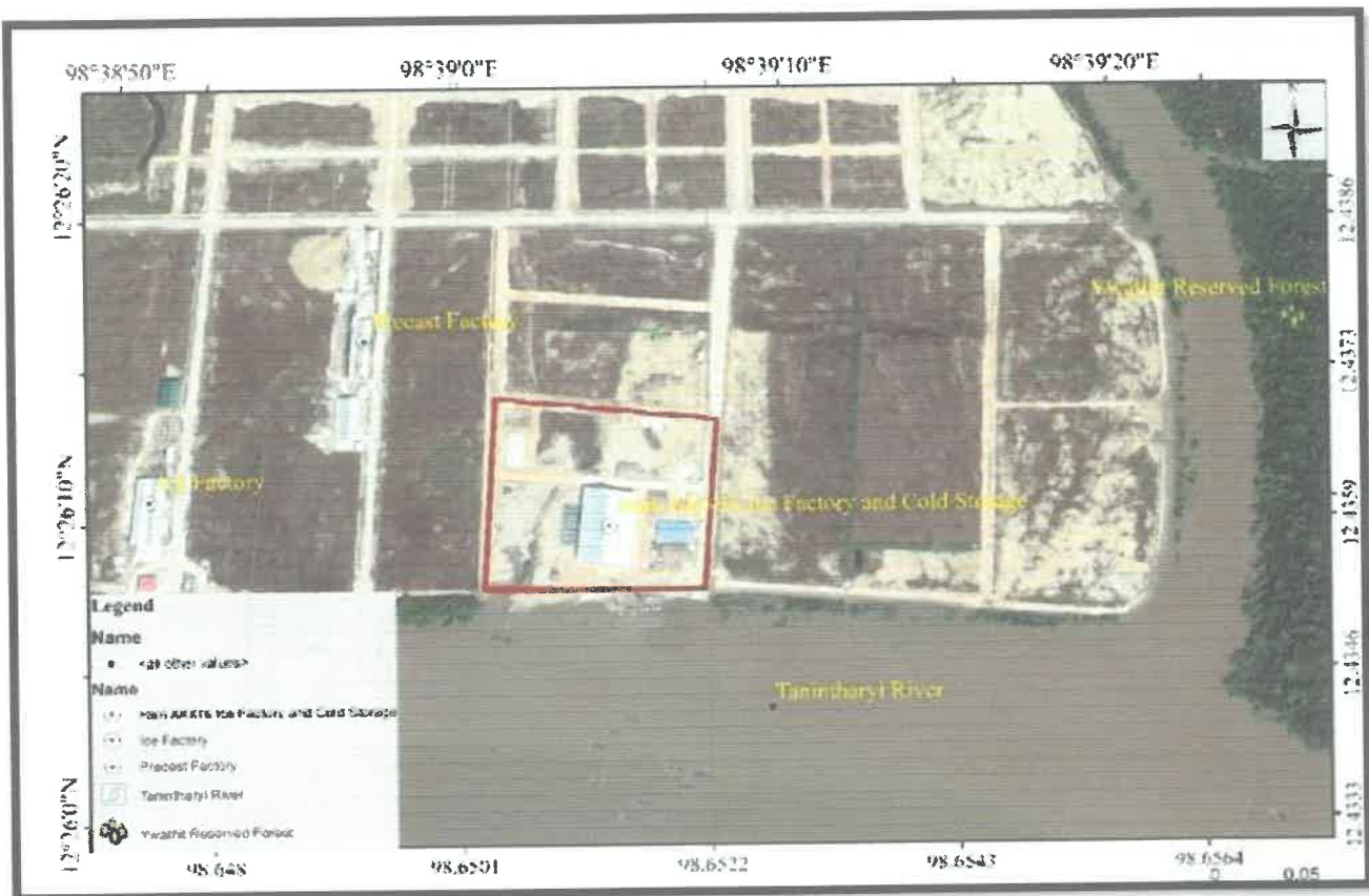
Figure 1 : စီမံကိန်းတည်နေရာပြမြေပုံ