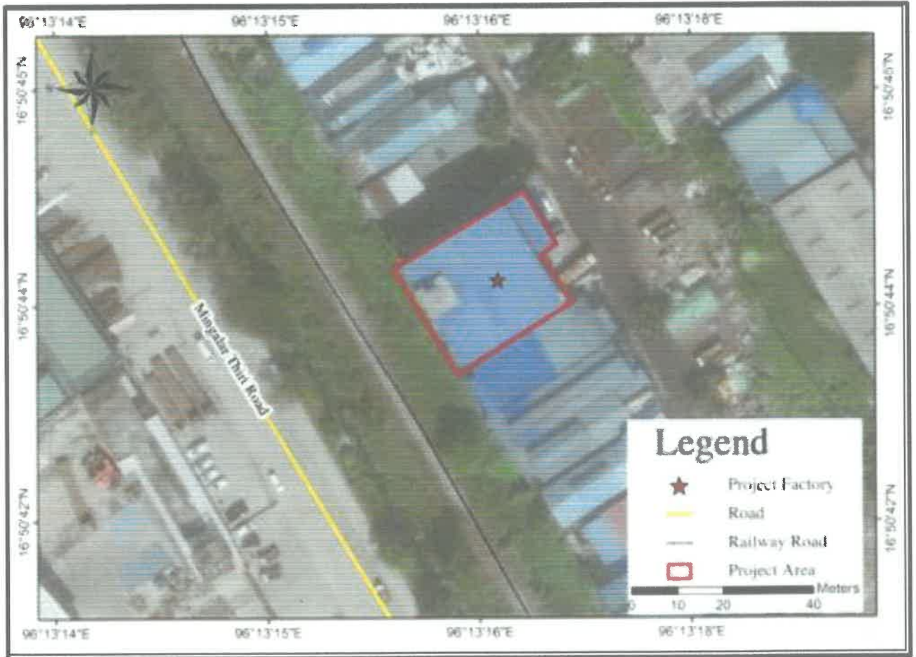
Figure 1: Location Map of Project

၅။ စီမံကိန်းတည်နေရာ။ ရန်ကုန်တိုင်းဒေသကြီး၊ တောင်ဒဂုံစက်မှုဇုန်၊ ဒဂုံရတနာလမ်း၊ (၆၄) ရပ်ကွက်၊ မြေကွက်အမှတ် ၂၅၁ (က)၊ မြေဧရိယာ (၀.၂၇၅) ဧကပေါ်တွင် တည်ရှိပါသည်။