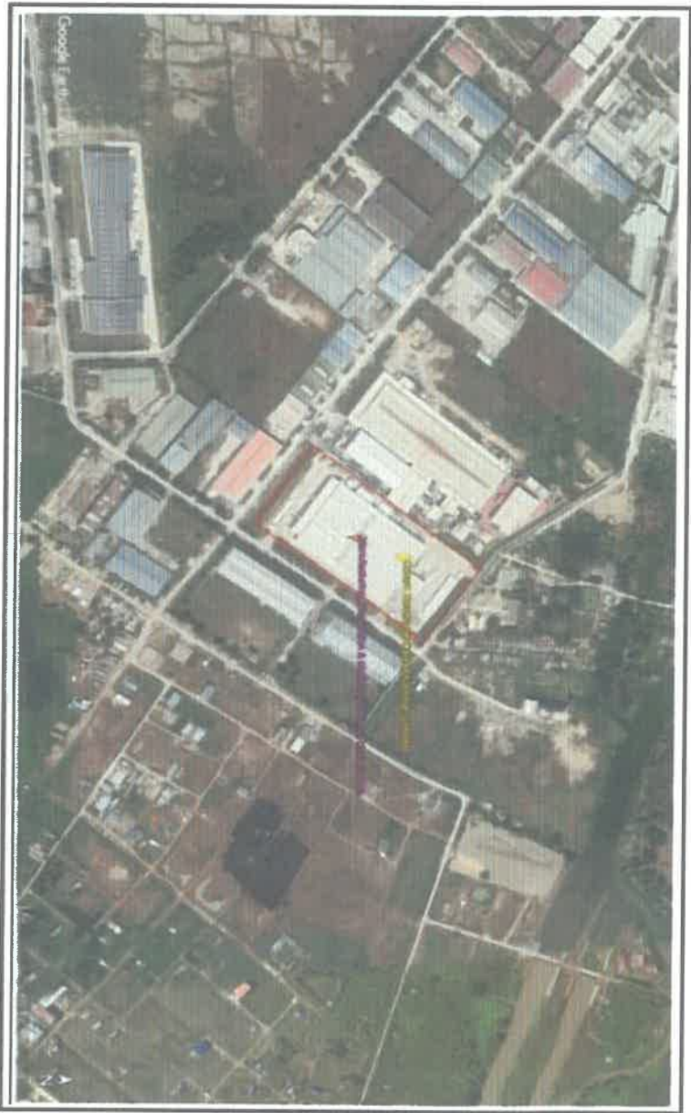
Figure 1 : စီမံကိန်းတည်နေရာမြေပုံ