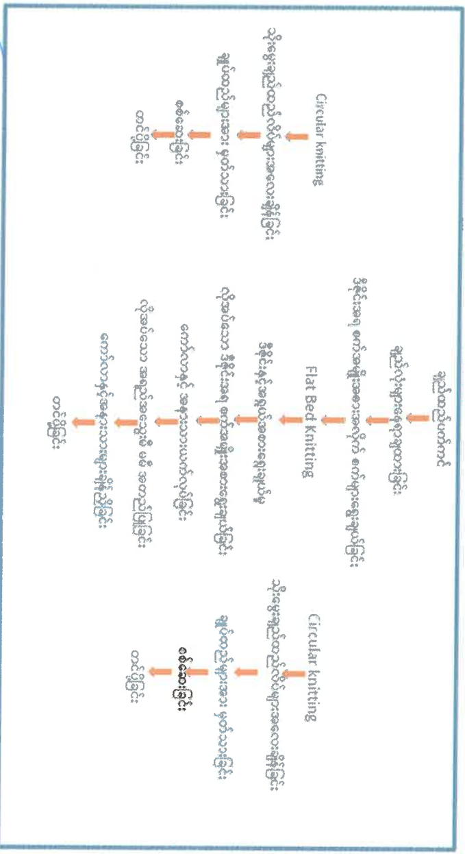
Figure 3: လုပ်ငန်းစဉ်အဆင့်ဆင့်ပြကားချပ်