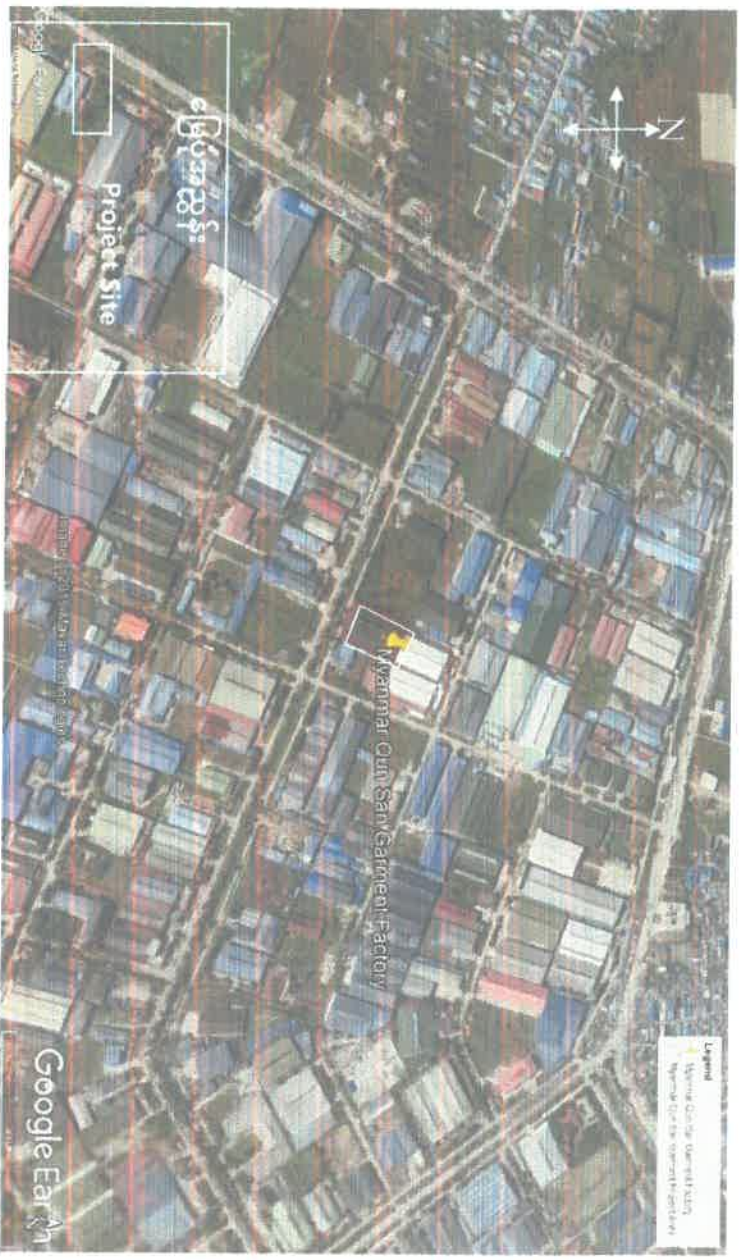
ပုံ ၁ : စီမံကိန်းတည်နေရာပြမြေပုံ