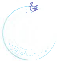
Figure 1 : စီမံကိန်း တည်နေရာမြေပုံ