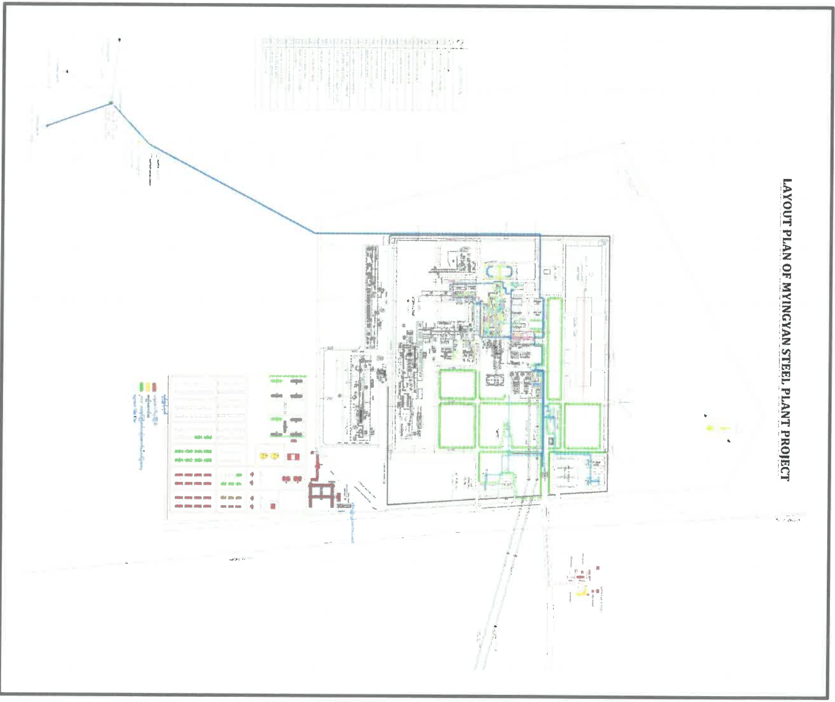
ပုံ(၂) - စီမံကိန်းဧရိယာအတွင်း အလုပ်ရုံများ ဖွဲ့စည်းထားရှိမှုပုံစံ