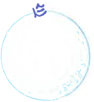
ပုံ(၁) - စိမ့်ကိန်းတည်နေရာပြမြေပုံ