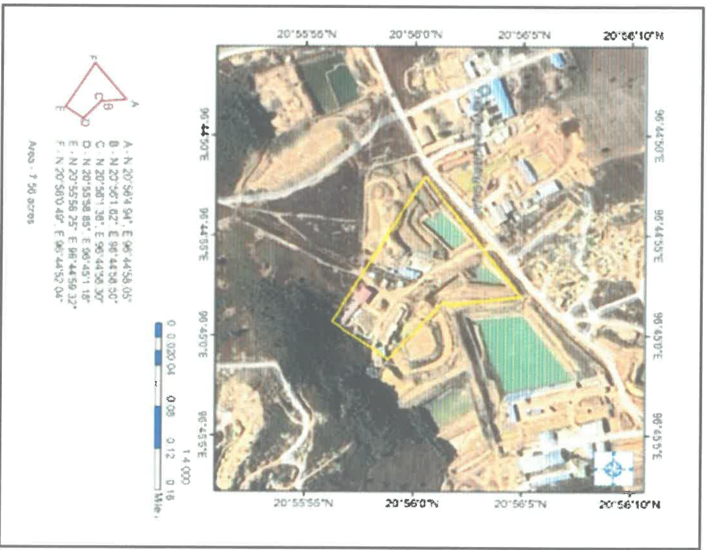
Figure1: Location map of Project