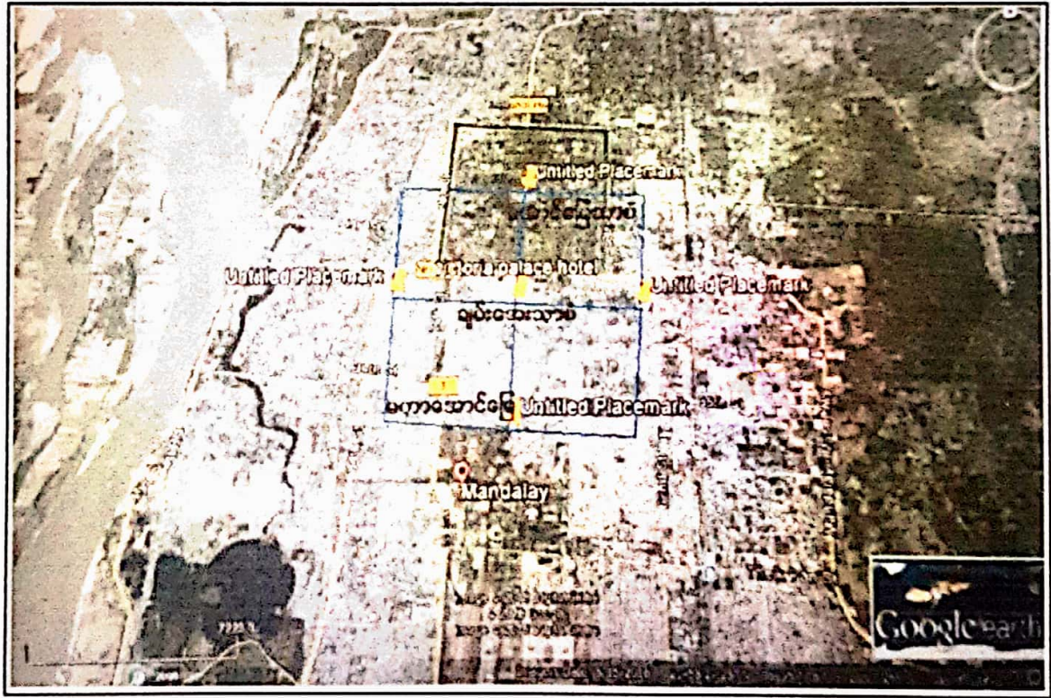
Figure 2: စီမံကိန်း၏ အနီးပတ်ဝန်းကျင်ပြမြေပုံ