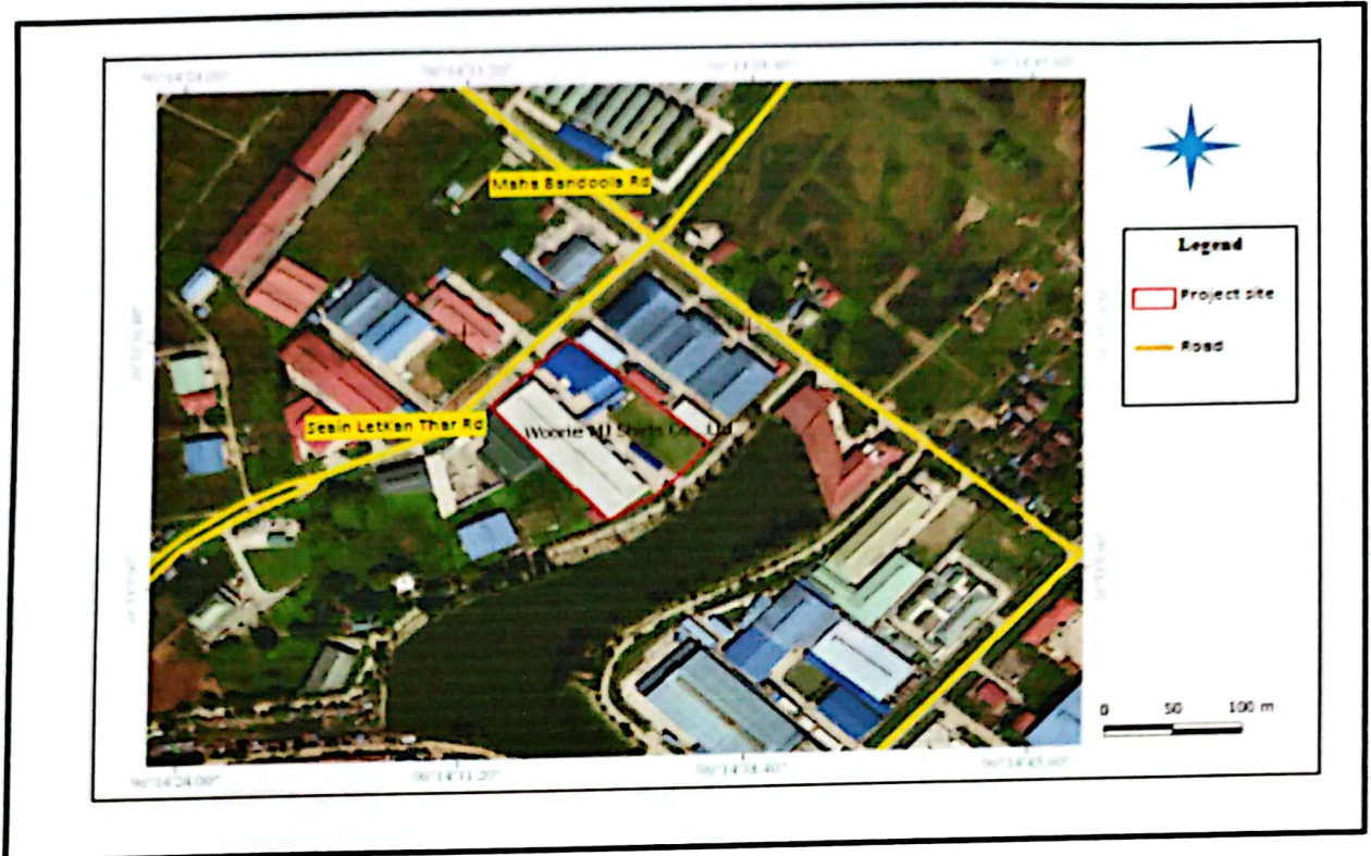
Figure1: Location map of Project