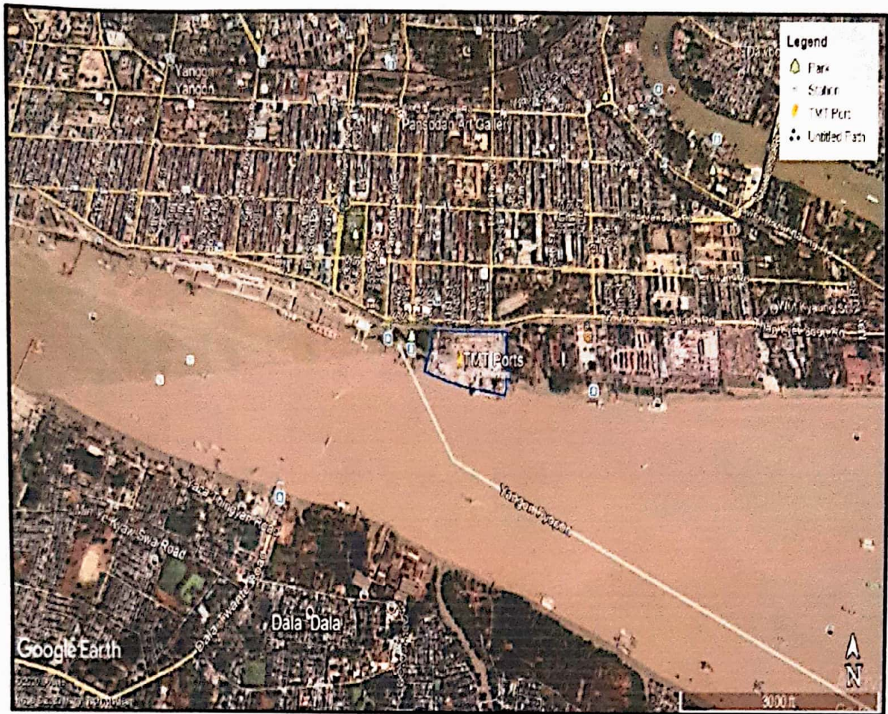
Figure 1: Location Map of TMT Ports